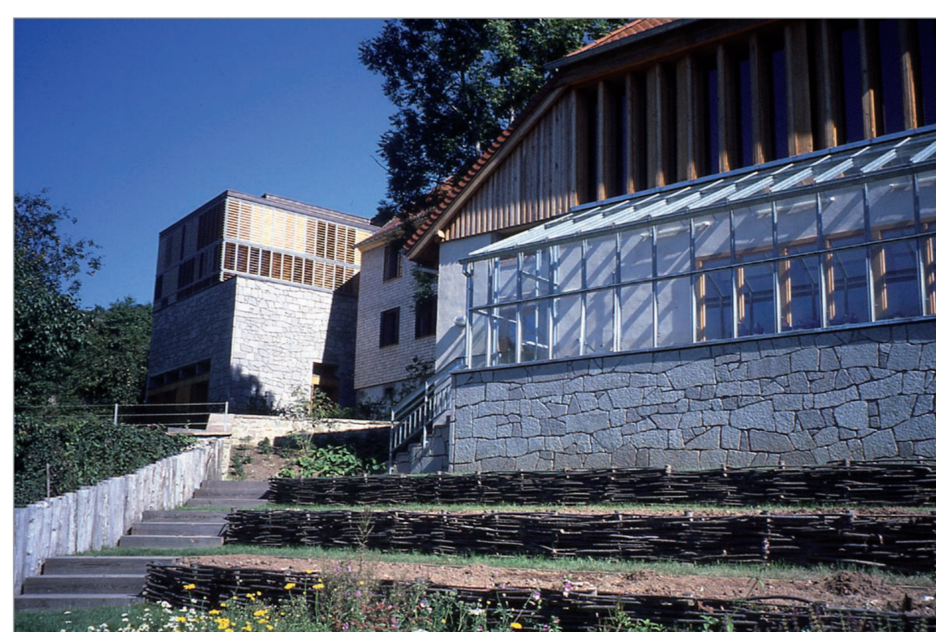
Architecture alliant tradition et modernité au Musée Oberlin - Waldersbach