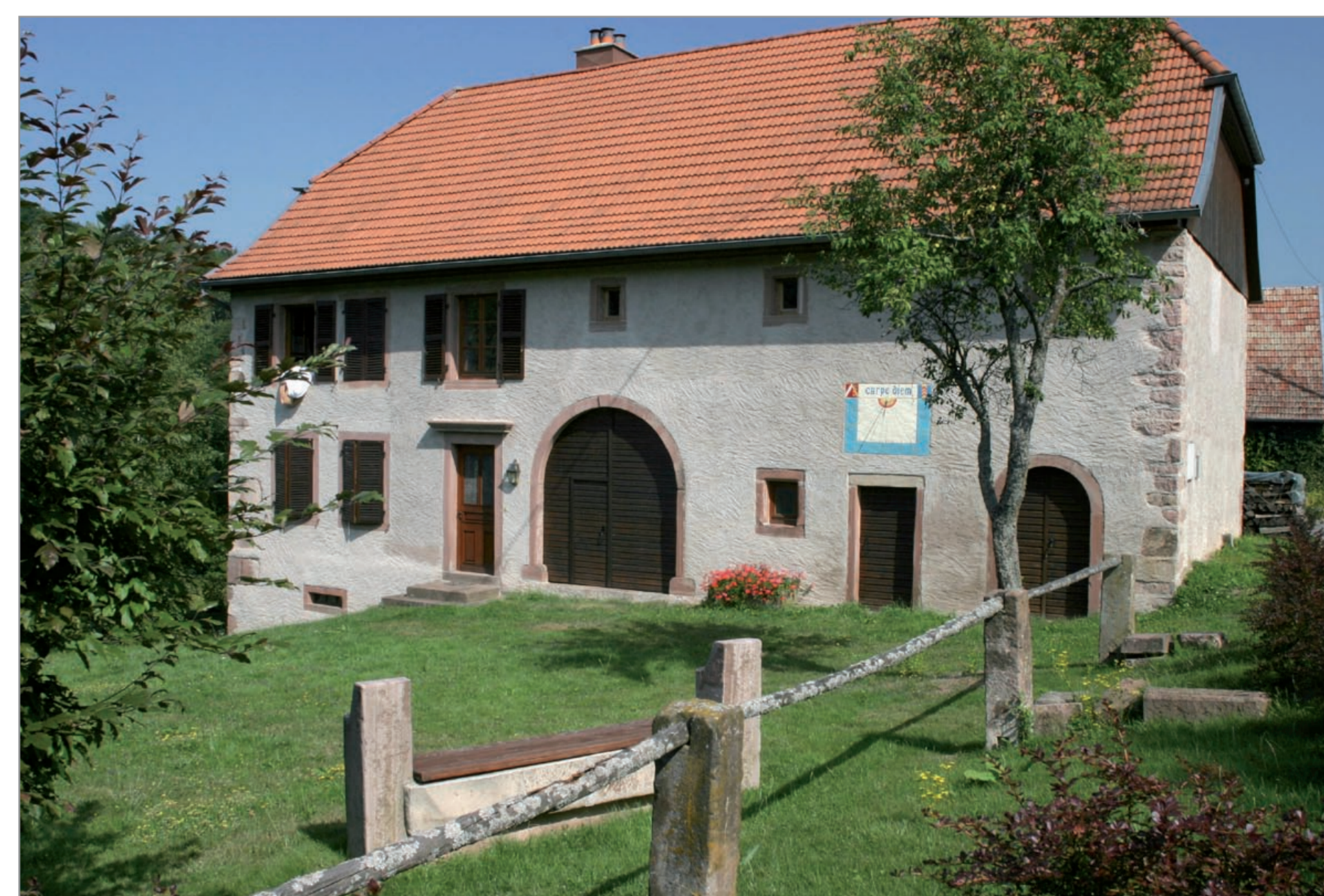
Rénovation d'une ferme vosgienne honorant l'esprit des lieux - Blancherupt