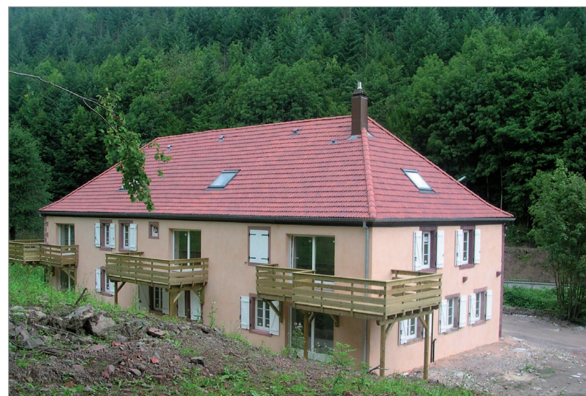
Réhabilitation d'un habitat collectif Wackenbach - Schirmeck

Les Collectivités se doivent d'agir en intégrant la dimension paysagère à leurs projets d'aménagements et aux Plans Locaux d'Urbanisme. Exemple d'étude préalable à l'aménagement du site des Ecrus à La Broque.