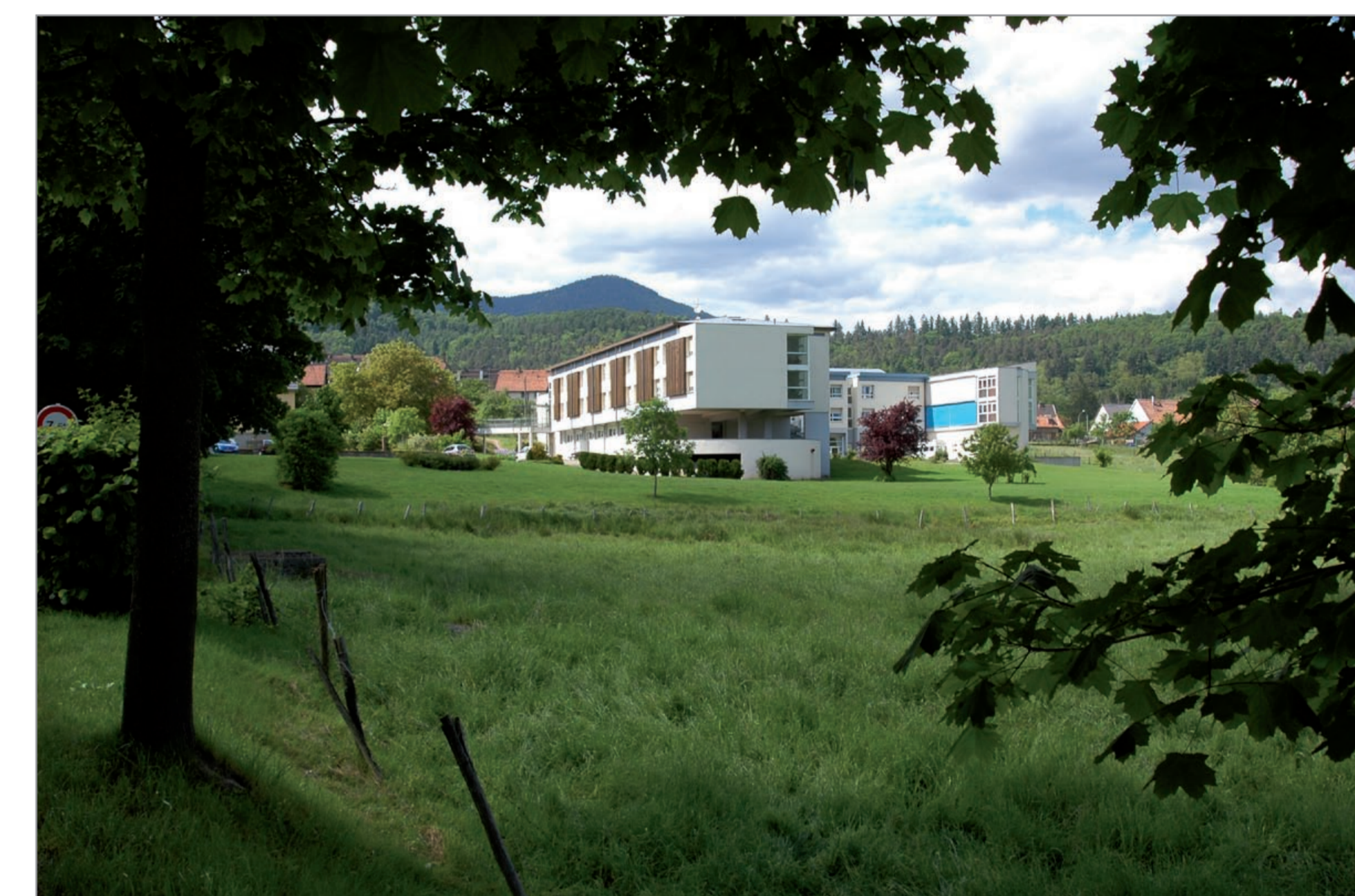
Alignement d'arbres et prairie soulignant l'entrée du village - Lutzelhouse