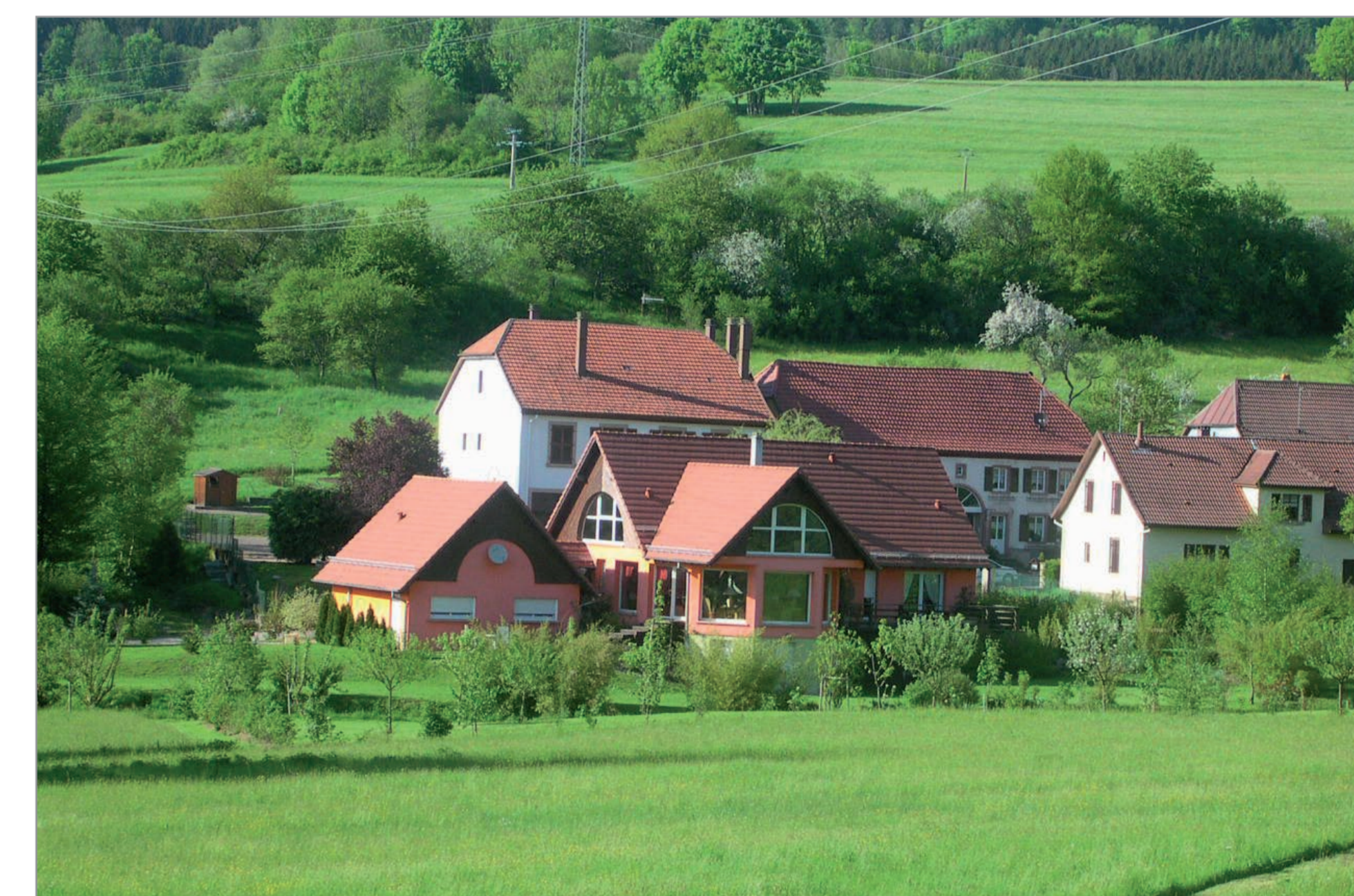
Intégration dans l'alignement de la rue d'un habitat individuel contemporain - Ranrupt