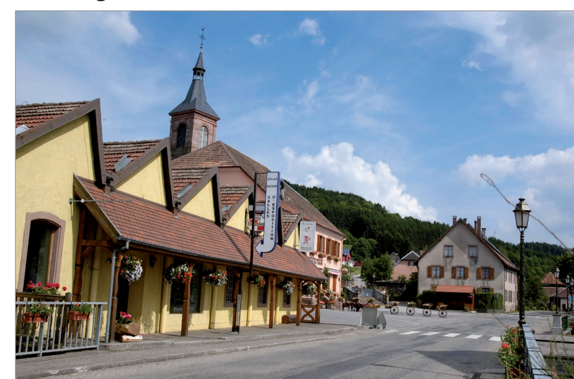
Réaménagement d'une ancienne filature au cœur du bourg - Ranrupt