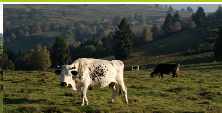
La Haute Goutte vue de Nätzwiller / Vache vosgienne - Col de la Percheux