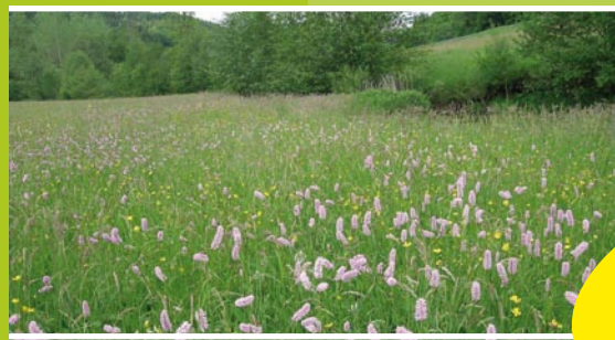
Prairie à Renouée Bistorte