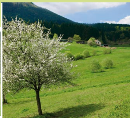
AFP «La Climoisine» - Ramupt