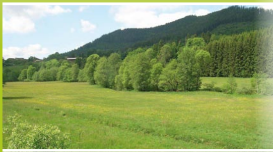
AFP «La Haute-Bruche» - Bourg-Bruche