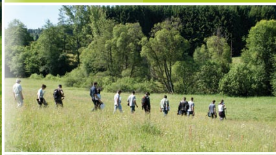
Journée prairie, mai 2011 - Ramupt