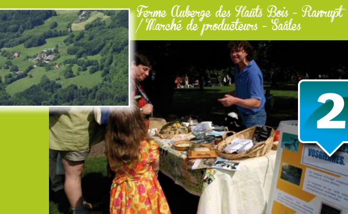
Ferme Auberge des Hauts Bois - Ramupt / Marché de producteurs - Saales

La prairie est un lieu privilégié : si elle n'est plus exploitée, le milieu se ferme, se dégrade. Son abandon est révélateur de la fermeture des paysages et d'une perte de qualité du «bien vivre» dans la vallée.