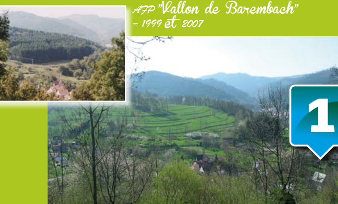
APP "Vallon de Barembach" - 1999 et 2007