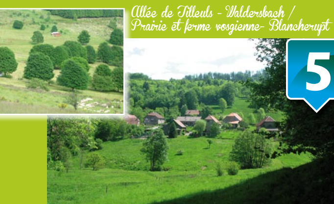
Allée de Tilleuls - Wildersbach / Prairie et ferme vosgienne- Blancherupt

La beauté des paysages est liée à cet enchaînement d'espaces ouverts composés à 99% par des prairies et d'espaces forestiers et urbanisés. C'est le vecteur d'un développement touristique durable en lien avec les ressources locales.