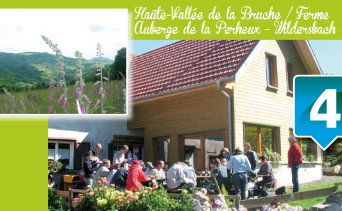
Haute-Vallée de la Bruche / Ferme Auberge de la Perheux - Wildersbach

Ce paysage de prairie de montagne constitue un véritable réservoir biologique que ce soit du point de vue faunistique comme du point de vue floristique ; son importance est en totale adéquation avec les pratiques agricoles développées.