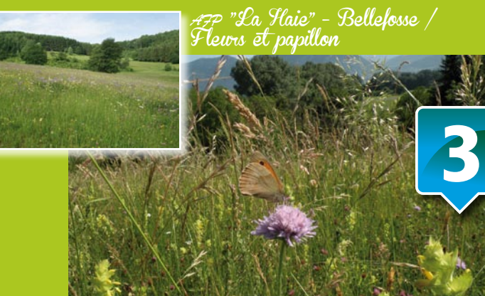
APP "La Haie" - Bellefosse / Fleurs et papillon

La prairie est une ressource : elle constitue la base de la ration alimentaire des troupeaux. Elle est le support de l'activité agricole sur le territoire : les acteurs agricoles vivent sur ces terres et génèrent les espaces ouverts.