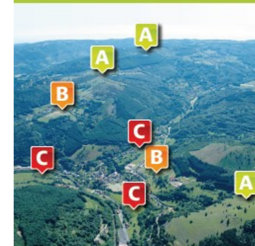
Ban de la Roche - Vue aérienne 2006