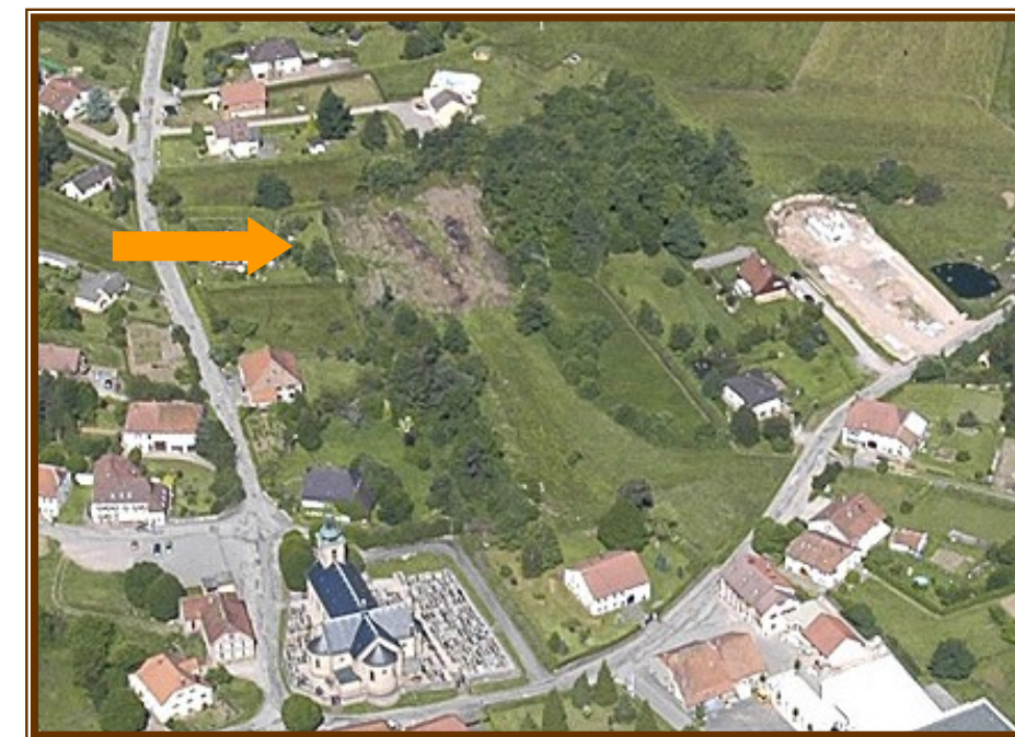
Vue aérienne après les travaux.