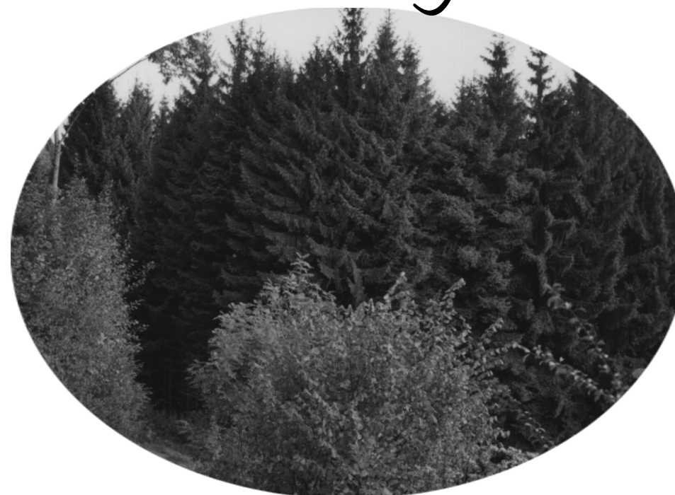
Vue depuis ce point avant la coupe de la sapinière