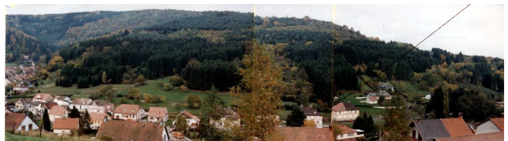
Commune de La Broque AFP « Du vallon d'Albet » : Site avant travaux et après travaux