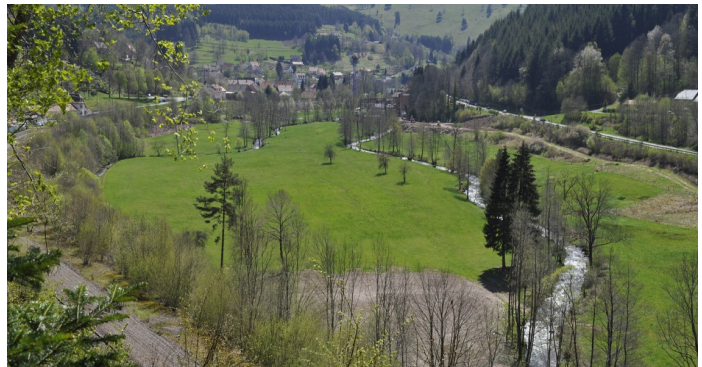
Communes de Fouday et Plaine AFP « Entre les eaux »