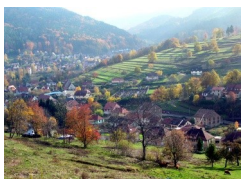
Réouverture paysagère commune de La Broque

projet de développement local : l'exemple de la Communauté de communes de la Vallée de la Bruche (CCVB) dans le Bas-Rhin.