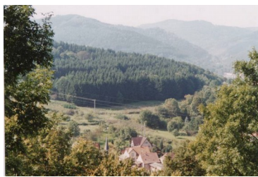
Commune de Barembach AFP « Du vallon de Barembach » : Site avant travaux et après travaux

économie locale donnent une force et une légitimité pour maintenir ces espaces ouverts et entretenus. L'outil AFP, à l'origine envisagé sous l'angle foncier et agricole, puis pour améliorer le cadre de vie, devient aujourd'hui un outil d'urbanisme car il permet de contenir le développement urbain. Pour que ces espaces maintenant ouverts ne soient pas à nouveau convoités par l'urbanisation à moyen terme et pour permettre à la vallée de se développer, il s'agit maintenant de travailler sur la densification du tissu existant à l'échelle de la vallée.