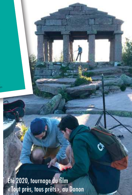
Été 2020, tournage du film « Tout près, tous prêts », au Donon