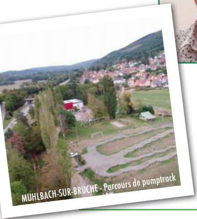
MUHLBACH-SUR-BRUCHE - Parcours de pumtrack

Au-delà de la qualité de notre cadre de vie, la communication et le haut débit sont des arguments à mettre en avant pour favoriser le télétravail, attirer de nouveaux habitants permanents et convaincre de petites entreprises. C'est vital pour maintenir nos commerces, nos structures scolaires et périscolaires. Avec notre parcours de pumtrack et nos itinéraires de randonnées pédestre ou VTT, nous avons également des atouts à valoriser en matière de tourisme sportif. ♡