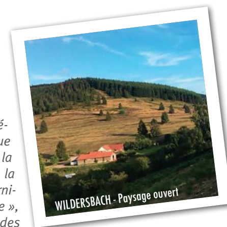
WILDERSBACH - Paysage ouvert

Site intercommunal, la ferme de La Perheux est également un atout important dans la vie et pour la notoriété de notre village au sein de notre territoire. Le programme d'extension en cours devrait encore en renforcer l'intérêt agricole et touristique. Il nous faudra toutefois veiller à préserver l'environnement de ce lieu naturel d'exception. C'est cet équilibre qui constitue depuis longtemps le cercle vertueux de notre dynamique intercommunale et nous permettra de continuer d'assurer la qualité de vie et la pérennité de nos villages. ♡