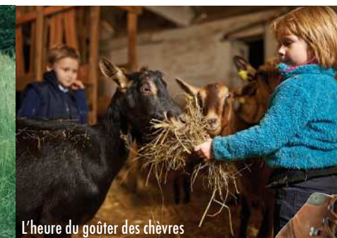
L'heure du goûter des chèvres