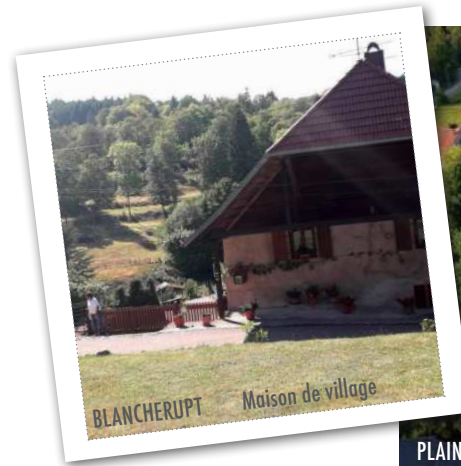
BLANCHERUPT - Maison de village