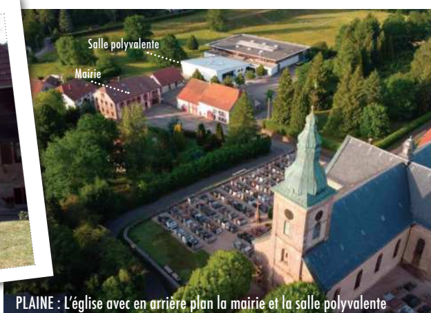
PLAINE : L'église avec en arrière plan la mairie et la salle polyvalente