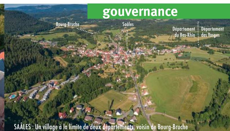
SAÂLES : Un village à la limite de deux départements, voisin de Bourg-Bruche