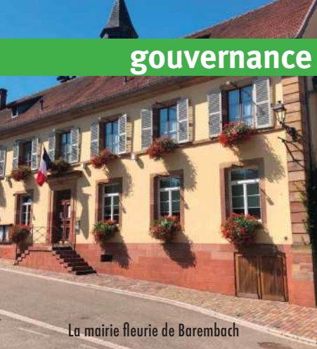
La mairie fleurie de Barembach